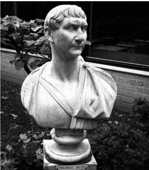
Het beeld van keizer Trajanus