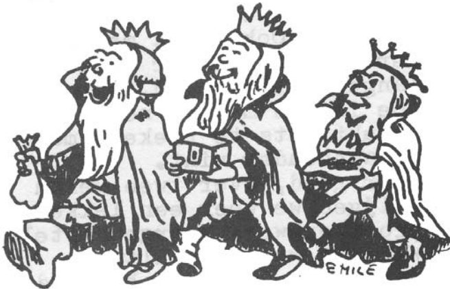
De drie koningen” (Kariljon dec. 1986) getekend door Emile Gregoire