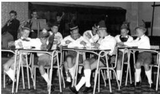
Uitvoering van de cantate Der Schulmeister van Telemann in 1962 op Beekvliet