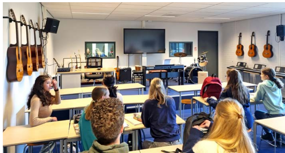
Een impressie van het nieuwe muzieklokaal