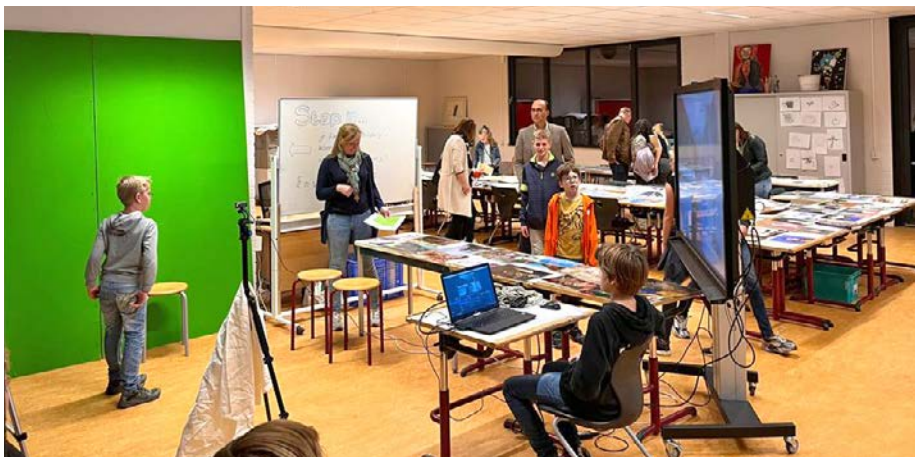
Kunst maken met een greenscreen tijdens de Open Avond

oktober, werd voor het eerst een Open Avond gehouden. De school zette de deuren open voor leerlingen van groep 7 en 8 en hun ouders om een kijkje te komen nemen in het vernieuwde schoolgebouw in verschillende vaklokalen. Voor het eerst in twee jaar bruipte de school weer van de nieuwsgierige basisschoolleerlingen. De sfeer was uitermate gemoedelijk en de reacties op het nieuwe schoolgebouw waren zeer positief. Een goede start van de voorlichtingsactiviteiten van dit schooljaar, inmiddels gevolgd door de bekende Beekvliet Experiencemiddagen en de Open Dag eind januari. Laat begin maart de aanmeldingen maar binnenstromen!