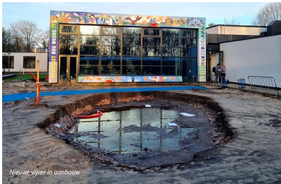
Nieuwe vijver in aanbouw