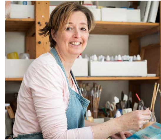
Beeldend kunstenaar, maart 2022

Tot die ene dag in de zomer van 2000. Toen veranderde mijn wereld van het ene op het andere moment. Tijdens een zakenreis in Duitsland werd ik als autopassagier aangereden door een trein. Het was een wonder dat ik het overleefde en in eerste instantie leken de gevolgen mee te vallen. Ik kreeg er wel een andere kijk door op het leven en besloot werk te maken van een wens, die al een tijdje sluimerde. Ik volgde een cursus Experimenteel schilderen. Het was een schot in de roos. Vooral het maken van abstracte schilderijen met structuur, waarin ik allerlei natuurlijke materialen en persoonlijke voorwerpjes verwerk, veroverde mijn hart. En ik bleek er talent voor te hebben. Om meer over schildertechnieken te leren, bezocht ik door de jaren heen open ateliers van diverse kunstenaars. Daarnaast schilderde ik veel in mijn atelier aan huis. Zo ontwikkelde ik mijn eigen stijl en een persoonlijke werkwijze