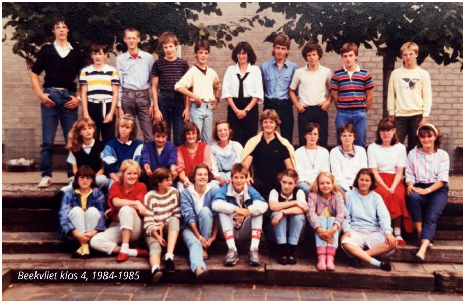
Beekvliet klas 4, 1984-1985

Hoe ik bij deze persoonlijke missie ben gekomen? Dat is een lang verhaal. Laten we beginnen bij het begin. Als jong meisje had ik een zéér bescheiden droom. Ik wilde de Olympische Spelen organiseren in Nederland. Daarom ben ik na Beekvliet Bedrijfskunde aan de