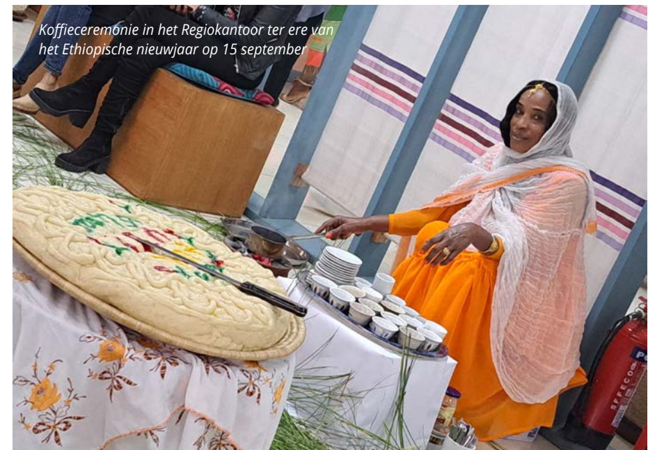
Koffieceremonie in het Regiokantoor ter ere van het Ethiopische nieuwjaar op 15 september

Ik vind het wel een aanrader als land, ook voor huidige studenten, om te overwegen om te studeren en later misschien te werken. Je hebt er onder andere de mogelijkheid om tijdens je Bachelor of Master een volledig betaalde stage van ruim 6 maanden te doen, waardoor veel mensen waardevolle