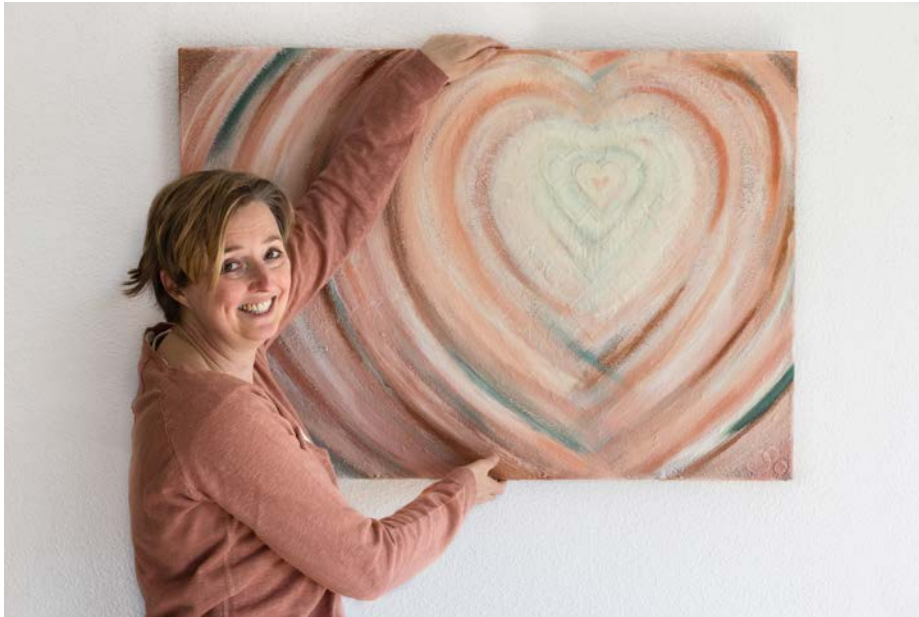
Schilderij op maat: 'Warm bad'

me nog meer bewust van wat écht belangrijk is. Ik ging deze lichtpuntjes uitwerken in autobiografische verhalen, die ik publiceerde op mijn eigen website. Het schrijven werkte helend en ik bleek er bovendien anderen mee te inspireren. Het hielp me een positieve wending te geven aan alle nare gebeurtenissen en er kwam zo ook weer ruimte voor nieuwe dromen. Het in 2012 waarmaken van mijn jeugdroom om naar de Olympische Spelen te gaan, was een keerpunt. Ik realiseerde me dat het in mijn nieuwe levensomstandigheden nog steeds mogelijk is om mijn dromen te realiseren. Natuurlijk wel op een andere manier dan voorheen, maar het kan wél.