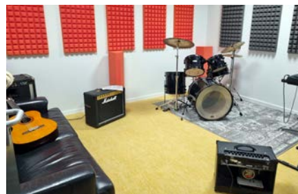
In de vier muziekstudiotjes kunnen leerlingen met allerlei instrumenten aan de gang.

'werkruimtes': vier kleine, aan het lokaal grenzende muziekstudio's waar tijdens en buiten de lessen geoefend kan worden. Het bijbehorende meubilair liet door leveringsproblemen tot december op zich wachten, maar inmiddels zijn deze nieuwe lokalen helemaal naar wens ingericht.