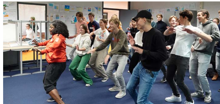
Klas 5 vol overtuiging in actie tijdens de workshop Afrikaanse dans

het vieren daarvan nooit goed uit de verf gekomen. Gelukkig is hij nu ook vereeuwigd in de Beekvliet-annalen. Terwijl de leerlingen voorzien van een appelflap huiswaarts keerden, ging voor de jubilarissen het feest nog even door in het bijzijn van hun (oud-)collega's en andere gasten. In de aula werden