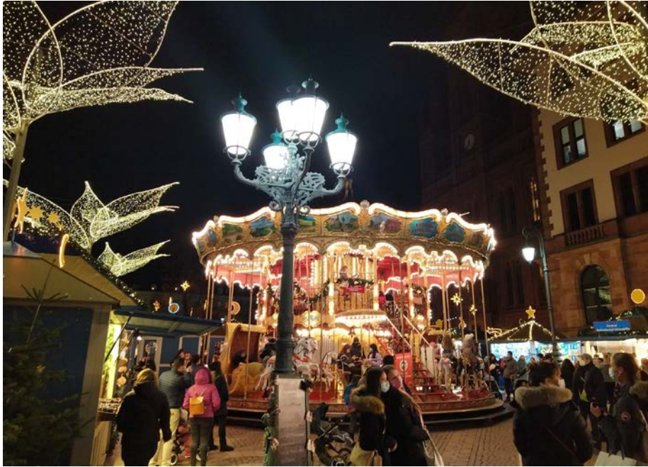
Kerstmarkt in Wiesbaden, een van de highlights van onze tijd in Duitsland

natuurlijk het vliegen zelf. Helaas ben ik tijdens het vliegtraject in Amerika 'uit de opleiding gevlogen'. Dat was best heftig omdat ik nooit had nagedacht over wat ik dan zou willen worden laat staan wat ik zou willen gaan studeren. Ik was toen net 19, en had meteen ook een enorme studielening aan mijn broek.