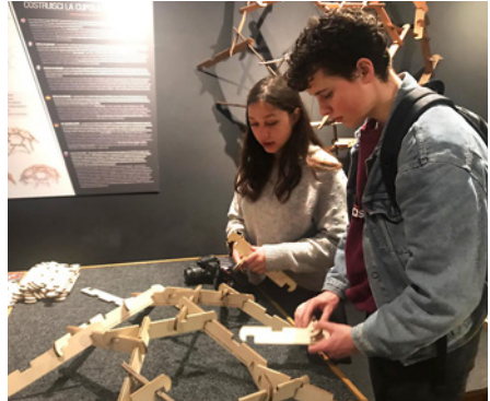
Constructies van Leonardo da Vinci nabouwen in Florence.

Half maart ging vrijwel heel klas 5 op pad voor de jaarlijkse culturele en uitwisselingsreizen. Waar de uitwisseling met Derby College uit Engeland al zijn