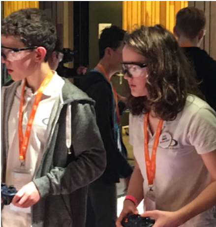
Team Panic Attack in actie tijdens de finale van de First Tech Challenge.

Van een andere orde is de deelname van twee Beekvliet-teams aan de First Tech Challenge: een robotwedstrijd voor middelbare scholieren, waarin (met name) bovenbouwleerlingen zelf een robot ontwerpen en programmeren, die vervolgens een reeks opdrachten moet kunnen uitvoeren. Team FTC-Units, bestaande uit vierde- en vijfdeklassers, deed voor het tweede jaar mee aan deze wedstrijd en had op Beekvliet een tweede team geïnspireerd om ook deel te nemen.