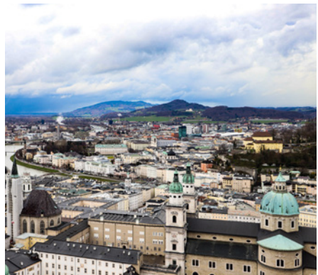
Prachtig uitzicht over Salzburg.

vijftiende editie beleefde, waren er ook enkele nieuwe bestemmingen, naast de inmiddels 'vaste prikken' Londen, Berlijn en Krakau. Na een geslaagde kleinschalige test vorig jaar ging nu een grote groep naar Florence voor een programma met veel kunst, cultuur, opera en Leonardo da Vinci. Ook Salzburg was