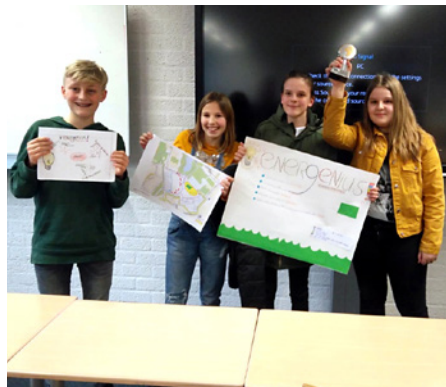
Het winnende GeoBattle-team toont ontwerp en bokaal.

Een nieuw initiatief, dat volgend jaar wellicht weer meer basisschoolleerlingen naar Beekvliet zal trekken, is de