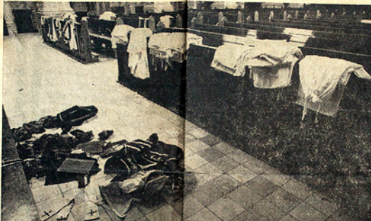
In de verlaten kapel van het seminarie Beekvliet liggen als getuigen van het rijke roomse leven de achtergelaten liturgische gewaden.

Die zal er nooit meer komen. Het oude Beekvliet is voorgoed vergaan. Er staan nieuwe kandidaten op de sloep die met het