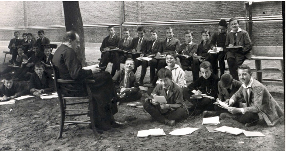
Les in de buitenlucht (ca. 1940)

In de jaren zestig en zeventig ontwikkelde Beekvliet zich tot regulier gymnasium. In 1958 zaten er op Beekvliet nog 402 leerlingen, een hoogtepunt. Maar in 1965 was dat aantal teruggezakt tot 324 en in 1969 tot 251. Ook daarna bleven de roepingen tot het priesterambt afnemen. Wat op Beekvliet uiteindelijk overbleef waren externe leerlingen uit de omgeving. Ook meisjes kregen voortaan toegang. Net als andere seminaries ondervond dat van Beekvliet in de jaren zestig de gevolgen van het afnemende aantal priesterroepingen. In 1972 werd het kleinseminarie Beekvliet gesloten. (...) De tijd van de interne leerlingen is voorbij, maar de oud-Beekvlieter die op de site van BHC zijn eigen ervaring kwijt wil, krijgt nu de kans. ★