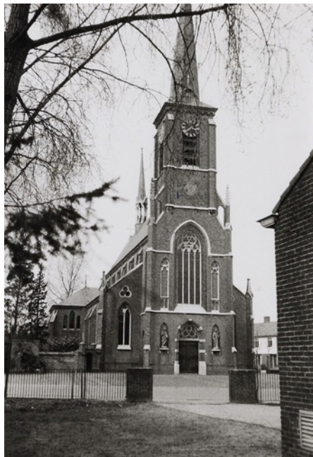
De kruiskerk in Westerhoven.

Piet Rijkers werd in Hapert geboren als jongste in een gezin van zeven kinderen. Na een jaar (extra) Franse les kon hij toegelaten worden tot het kleinseminarie Beekvliet. In 1950 stierf zijn moeder na een langdurig ziekbed. Dat had zo'n impact, dat hij dat studiejaar moest overdoen. In 1960 volgde zijn priesterwijding door bisschop Bekkers en werd hij benoemd tot kapelaan in Deurne-Zeilberg. Het was de periode van grote veranderingen in de kerk. Hij was lange