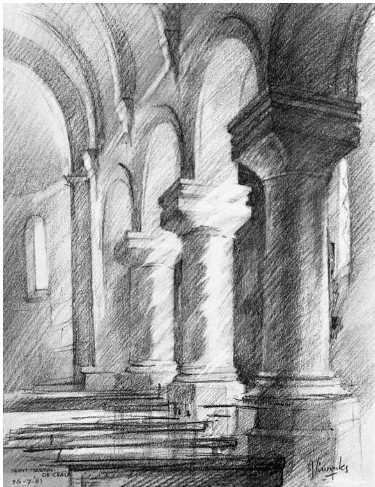
Interieur kerk St Martin de Crau (Fr), contepotlood (1981) Jan Lurinks

Het is een verademing, als je na een flinke wandeling in de hitte van de Provence, verkoeling kunt zoeken in een van de vele kerken, zoals hier in de kerk van Sint Maarten in Saint Martin de Crau.