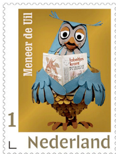
Baudet's uil van Minerva?

de redactie van het Eindhovens Dagblad boven zijn artikel had geformuleerd: "Beoordeel Baudet op wat hij als ideaal nastreeft." Deze kop suggereert iets anders dan wat de strekking van zijn artikel is.