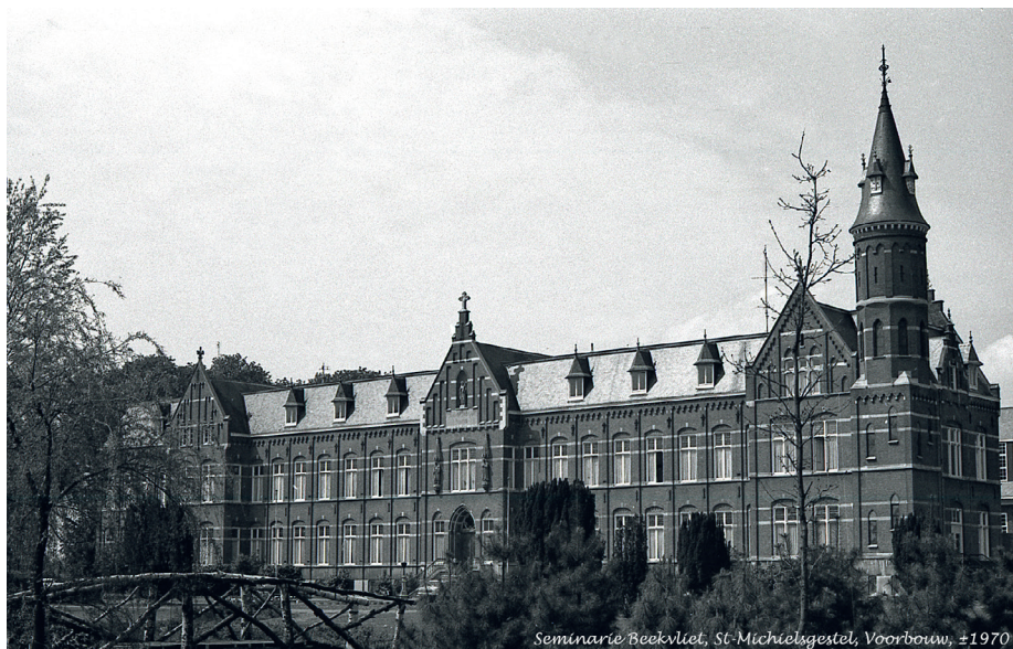
Seminarie Beekvlot, St-Michielsgestel, Voorbouw, ±1970