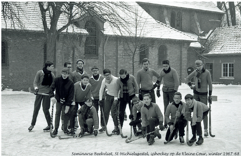
Seminarie Beekvliet, St-Michiëlsgestel, ijshockey op de Kleine Cour, winter 1967-68

leerling per jaar werd bijgelegd door het Bisdom 's-Hertogenbosch. Het Bisdom was ook verantwoordelijk voor de kosten van het groot onderhoud.