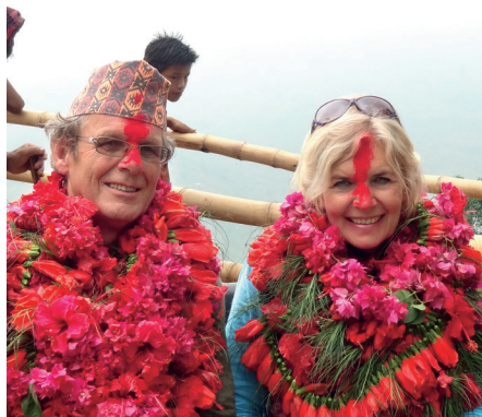
Versierd als kerstboom bij het afscheid van Nepal

Het leven in de mannengemeenschap van een seminarie was natuurlijk geen onverdeeld succes. Jongens, volop in de puberteit, moesten groot en ervaren worden, het leven leren onder begeleiding en het oog van mannen die ook altijd onder elkaar waren geweest, zonder meisjes. Die mannen waren ons rolmodel. Van bepaalde dingen wisten ze heel veel maar van dat andere deel van het leven vrijwel niets. En bij sommigen van hen bestond ook nog een verkeerde geneigdheid die ze op enkelen van ons uitleefden, van wie ik er één was. Nogal verknipt eigenlijk, als je het later, op een afstand bekijkt. Maar toen realiseerde ik