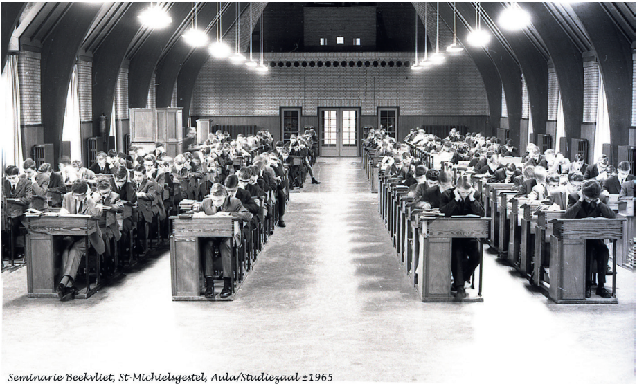
Seminarie Beekvliet, St-Michielsgestel, Aula/Studiezaal ±1965