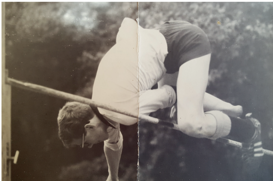
Schoolrecord (1,60 m) hoogspringen 1965, nog vóór de fosbury flop techniek

Als jongetje in de 4e klas van de lagere school wilde ik graag missionaris worden om naar Belgisch gebruik de negertjes in de Congo te bekeren. Onder andere daarvoor ging ik naar Beekvliet. Echter, opvallend weinig hoorde je daar over de arme medemens. En toch was ik naar Beekvliet gegaan om priester te worden en dienstbaar te zijn aan het volk. Is er daar toen iets van een sociaal zaadje geplant? In mijn studententijd werd ik meteen lid van de solidariteitsbeweging met Latijns Amerika. Daar kwam een paar jaar later de politieke 'dien-het-volk-golf' van Mao overheen. Als leraar zette ik de groep 'Maastrichtse scholieren voor een vrij Chili' op. Er volgde een scala van andere landen zoals Zuid-Afrika, Mozambique, Nicaragua waarmee ik me engageerde. Dat culmineerde uiteindelijk