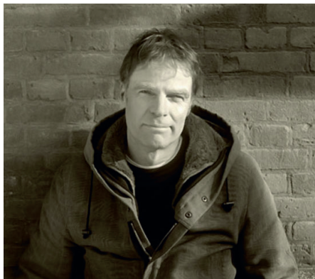
Winy Maas

Winy Maas, architect van onder andere de Markthal in Rotterdam, werd vorig jaar door Eindhoven aangesteld als supervisor van de binnenstad en adviseert de gemeente bij alle grote ontwikkelingen. (...) Twintigduizend extra inwoners moet de Eindhovense binnenstad over tien jaar tellen in de visie van Maas. Mensen die wonen in nieuwe woontorens, huizen die als blokken op bestaande gebouwen komen of in gebieden die compleet opnieuw ontwikkeld worden. Bewoners die moeten gaan zorgen voor meer levendigheid maar waarvoor in de huidige compacte binnenstad geen ruimte is. Maas staat bekend om zijn soms onnavolgbare gedachtesprongen en die maakte hij dinsdag ook volop in een presentatie vol humor waarin hij duidelijk liet zien een zwak te hebben voor Eindhoven. (...) Volgens de architect moet ook de fietser straks weer gewoon door de binnenstad kunnen, gewoon omdat dat bij Eindhoven past vindt hij. (...)