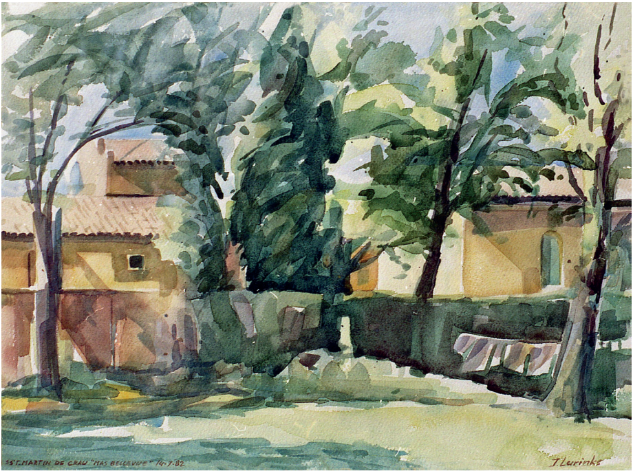
"Mas Bellevue", St.Martin de Crau (Fr.), aquarel (1982)