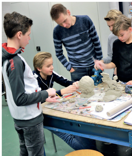
Brugklassers beelden mythologische figuren uit met klei.

In de week van 15 tot en met 19 januari werden op Beekvliet geen reguliere