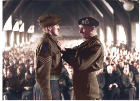
Britse veldmaarschalk Montgomery reikt eind 1944 op Beekvliet onderscheiding uit

Aan alle mooie dingen komt een eind. Als bij tijden briljante maar over het algemeen toch maar zeer middelmatige leerling legde ik dit schooltraject in zes jaar af. Niet slecht misschien, maar het vakkenpakket waarmee ik de eindstreep haalde, was vlees noch vis.