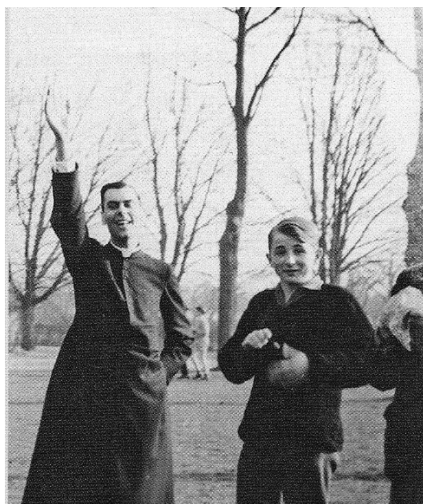
Bluysen als surveillant op Beekvliet

Toch kan Bluysen bepaald niet worden beschouwd als een brokkenmaker, maar eerder als een eigentijdse bruggenbouwer (pontifex) die de tekenen des tijds verstond. Dat niet alle kerkelijke gezagsdragers zijn beleid ondersteunden - hetgeen een understatement genoemd mag worden - is uitvoerig te lezen in het biografische 'Gebroken Wit', dat over zijn roerige bisschopsperiode gaat. In zijn laatste boekje 'De donkere Stilte van God' - inhoudelijk en qua vormgeving een pareltje - keert Bluysen weer terug naar zijn vanouds geliefde thema van de mystiek. Je zou kunnen zeggen: een veilig onderwerp, immers los en vrij van kerkpolitieke kwesties. Toch werd hij onlangs nog in de actualiteit getrokken in verband met het misbruik in de kerk. Jan Bluysen toonde zich bereid om met een slachtoffer van seminarie Beekvliet te spreken. De oud-bisschop van Den Bosch gaf in dat gesprek aan destijds op Beekvliet van enig misbruik niets gemerkt te hebben. Bluysen begreep wel de frustratie en zei zich achteraf wel in zekere zin medeverantwoordelijk te voelen.